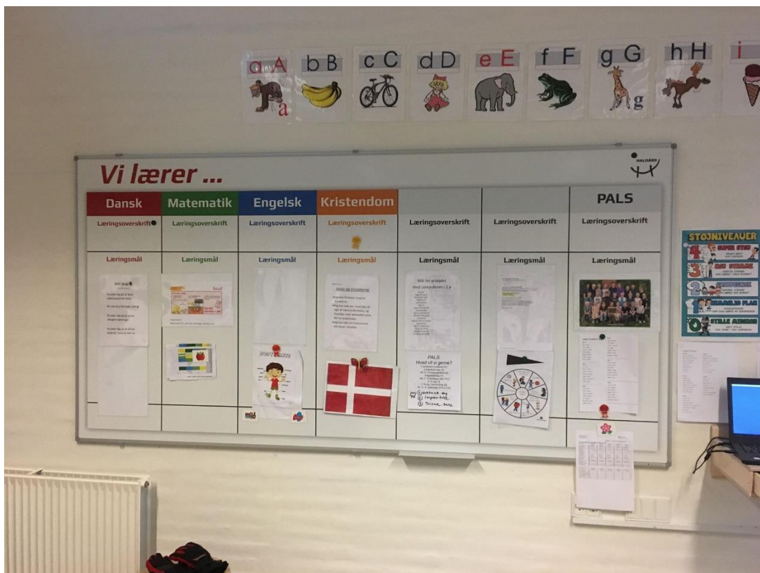
Læringstavle fra 2. kl.